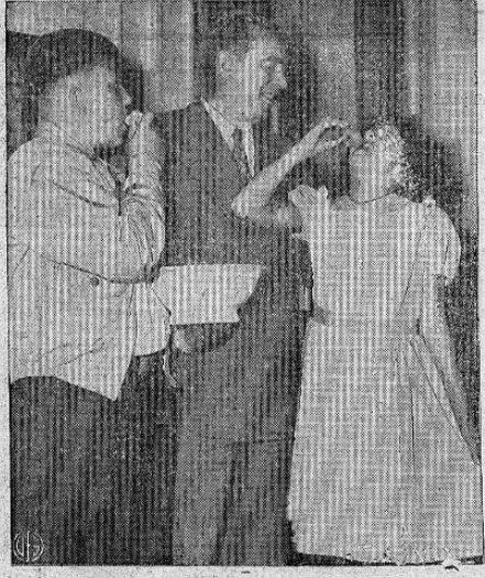
ENSEÑANDO AL ALCALDE A COMER ROSQUILLAS.—Estos dos niños que acompañan al Alcalde de Nueva York William O'Dwyer son los campeones de comer rosquillas de pan y aquí le están mostrando al señor Alcalde la forma como se pueden comer mejor.

Santiago de Chile, UP — Hasta el momento hay 27 detenidos de los cuales 25 han sido declarados culpables de proceso militar, relacionados con el fracasado complot de derrocar al gobierno.